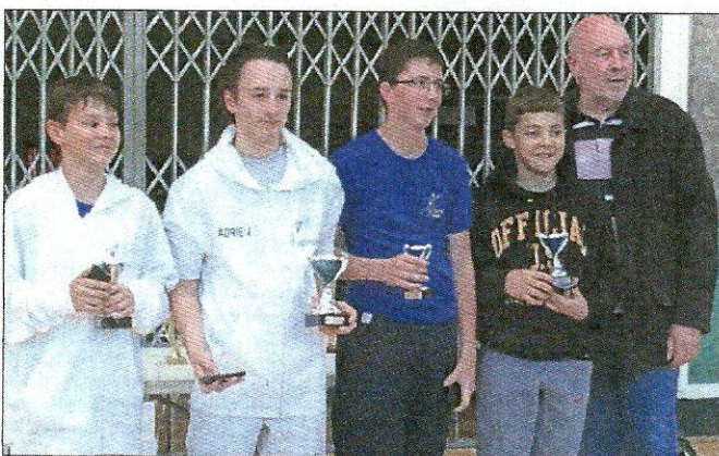
Les jeunes escrimeurs du CPEG ont brillé à Cannes.